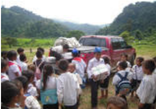
Ban Nong Kham

District de Vang Vieng - Première école construite par l'Association - 5 salles de classe - Sanitaires - 150 élèves Bâtiment terminé en 2006.