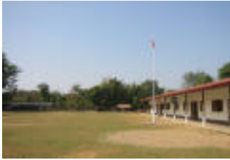
Ban Xaisom Boun