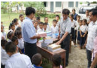
Ban Huey Khot

Ban Xaisom Boun, à 30 km au sud de Vientiane - 5 salles de classe - 150 élèves - Sanitaires - Une salle bibliothèque a été ajoutée en 2009