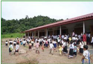
Ban Nong Kham