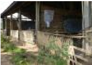
Ban Nam Or

Initié en 2008 et arrêté en 2013 par manque d'activités.