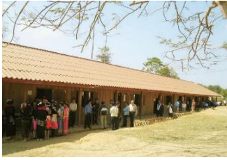
Ban None Hai