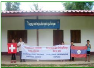
Ban Xaisom Boun