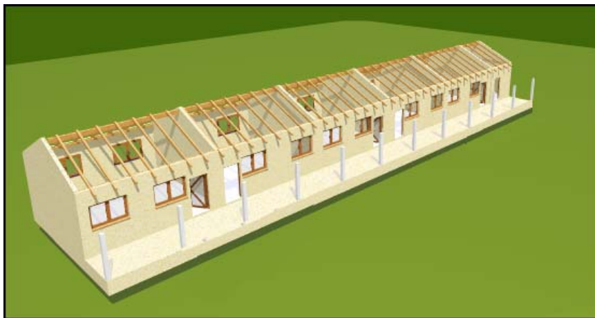
Charpente de toiture en métal pour tuiles